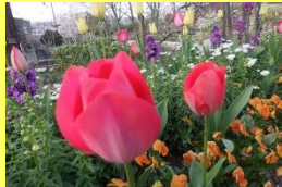
学名: Tulipa 科名: ユリ

「咲いた 咲いた チューリップの花が」と童謡に歌われるチューリップは、今も昔も春の定番です。