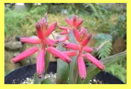
学名: Lachenalia 科名: キジカクシ