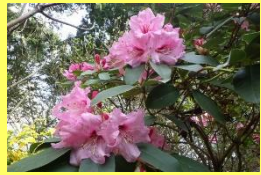
学名: Rhododendron 科名: ツツジ

日本原産のシャクナゲに比べ、花が大きく、色もカラフルで、数多くの品種があります。