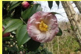
学名: Camellia 科名: ツバキ

ツバキにはたくさんの品種があり、晩秋から春にかけて入れ替わり立ち代り次々と花を咲かせてくれます。