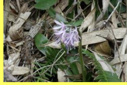
学名: Helonias orientalis 科名: シュロソウ