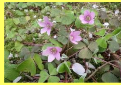
学名: Oxalis griffithii f. rubriflora 科名: カタバミ

山地のやや湿ったところに生える多年草です。普通花は白色ですが、このように淡い紫色を帯びるものがあります。