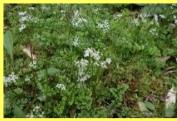
学名: Chamaele decumbens 科名: セリ

名前の由来は、春、先頭に咲くから「セントウソウ」、また仙人の住む「仙洞」の字をあてたとか諸説あります。