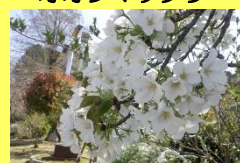
学名: Cerasus 科名: バラ