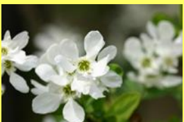
学名: Exochorda racemosa 科名: バラ