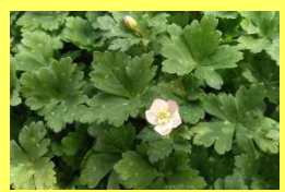
学名: Anemone flaccida 科名: キンボウゲ