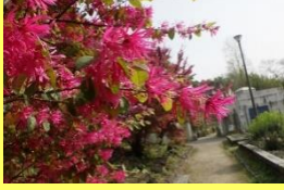
学名: Loropetalum 科名: マンサク

花は細いリボンのような花弁4枚から成り、枝先に密集して咲き、遠くから見ても華やかです。