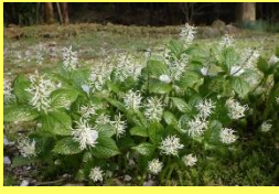
学名: Chloranthus japonicus 科名: センリョウ

花が咲いた姿を、静御前(シズカゴゼン)が一人で舞っている姿に見立て、名付けられたそうです。