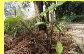
学名: Arisaema ringens 科名: サトイモ

「あぶみ」とは、馬に乗る際に足を置く馬具のことですが、かつて馬が多く飼育されていた武蔵の国で使用されました。