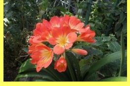
学名: Clivia miniata 科名: ヒガンバナ

雄大で気品あふれる花姿だけでなく、肉厚で光沢のある葉も観賞価値が高く、年間通して楽しめる植物です。