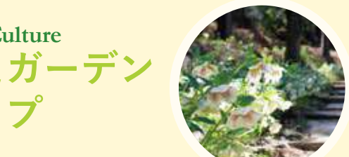
B クリスマスローズガーデン

四季折々の花が彩る装飾花壇。フォトスポット「はなぶんフラワードレス」は季節に合わせて衣替えをします。