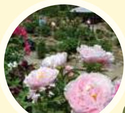
A ボタン・シャクヤク園

見頃:4月中旬～5月初旬 「百花の王」と呼ばれるボタンを約140品種・約200株、「花の宰相」と呼ばれるシャクヤクを約80品種・約120株栽培しています。