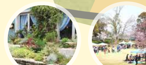
I HONEY SUCKLE CAFE

ケーキセットなどカフェメニューも充実。お食事は、園内のお好きな場所へ持ち出せます。