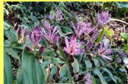
学名: Tricyrtis hirta 科名: ユリ

紫色の斑点のある花を咲かせます。斑点のようすを鳥のホトトギス(杜鵑)の胸に見立てた名前だといわれます。