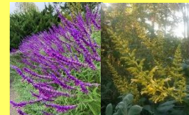
学名: Salvia 科名: シソ

紫の花穂が美しいレウカンサ、非常に大型になる‘イエローマジスティ’など秋咲きのものが各所で見られます。