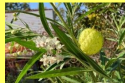
学名: Gomphocarpus fruticosus 科名: キョウチクトウ