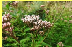
学名: Eupatorium japonicum 科名: キク

秋の七草のひとつ。地下茎を伸ばし群落を形成しますが、現在はその自生地が急速に失われつつあります。