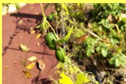
学名: Actinostemma tenerum 科名: ウリ

名前のゴキは「合器(ごうき)」からきていて、果実が強い反面、自生地の変化により数を減らしています。