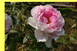
学名: Rosa 科名: バラ

秋のバラの一輪一輪の美しさは、春のバラに勝ると言われています。今秋は特に、香りのバラがおおすすめです。