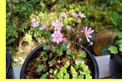
学名: Saxifraga fortunei var. alpina 科名: ユキノシタ

花の形が大の字に似ていることから、この名前がつきました。園芸品種には大の字に似ていないものもあります。