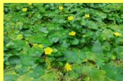
学名: Nymphoides peltata 科名: ミツガシワ

花は早朝から咲き始め、昼過ぎには萎みます。繁殖力が強い反面、自生地の変化により数を減らしています。