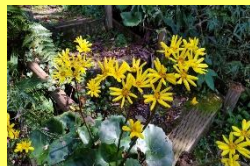
学名: Farfugium japonicum 科名: キク