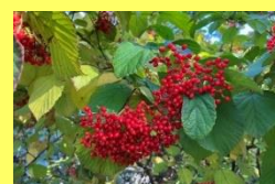
学名: Viburnum dilatatum 科名: レンブクソウ

花は5~6月頃に咲き、10月頃には鮮やかな赤色に熟した実が見られます。花より実を觀賞します。