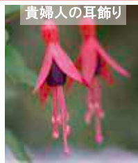
フクシア 5月上旬～6月下旬