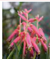
ラケナリア ～5月上旬