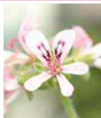
ペラルゴニウム 5月上旬～5月下旬