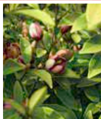
カラタネオガタマ 5月初旬～5月下旬