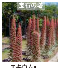
エキウム・ ウィルドプレティ 5月中旬～5月下旬