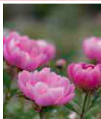
シャクヤク 5月初旬～5月中下旬