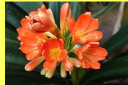
学名: Clivia miniata 科名: ヒガンバナ

豪華な花もさることながら、艶のある肉厚の葉は、花の時期でなくても、存分に存在感を発揮してくれます。