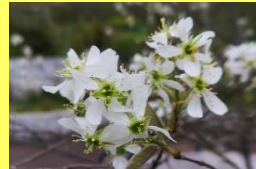
学名: Amelanchier spp. 科名: バラ

別名アメリカザイフリボク。6月ごろ赤い実を収穫し、ジュースやジャムに加工することができます。