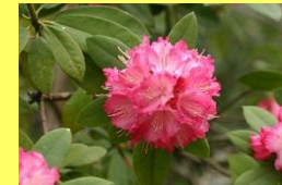
学名: Rhododendron 科名: ツツジ