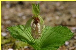
学名: Cypripedium japonicum 科名: ラン

大きな袋状のものと横に手を広げているような2枚の花弁です。自生地が急速に失われつつある絶滅危惧種です。