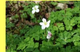
学名: Anemone flaccida 科名: キンボウゲ