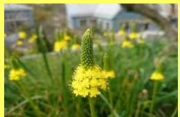
学名: Bulbinella floribunda 科名: ツルボラン

南アフリカ原産の球根植物です。日本でも古くから栽培され人気があります。別名はキャッツテール。