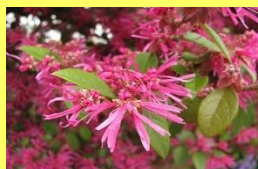
学名: Loropetalum 科名: マンサク

常緑のマンサクなので「トキワ」が付きます。紅花に少し遅れて白花が咲きますが、紅花は白花の変種です。