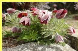
学名: Pulsatilla cernua 科名: キンボウゲ

花後の白い綿毛を老翁の白い頭髪に見立て、つけられた名前です。生薬として利用されますが、実は絶滅危惧種です。