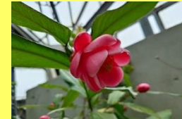
学名: Camellia amplexicaulis 科名: ツバキ

別名のハイドゥンは、原産地ベトナムでの呼び名を日本の音に当てました。旧正月の祝いに使われる花だそうです。