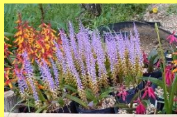
学名: Lachenalia 科名: キジカクシ