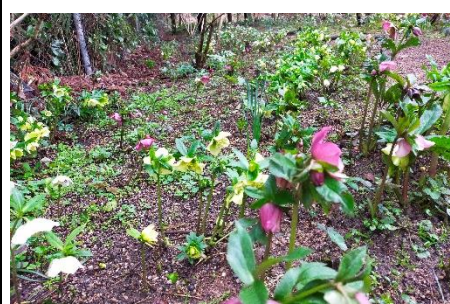
クリスマスローズ