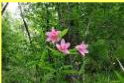
学名: Lilium rubellum 科名: ユリ

涼しい山地や亜高山帯の草原などに自生するユリです。別名「オトメユリ」ともいいます。