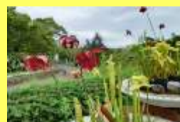
学名: Sarracenia 科名: サラセニア

北アメリカ南東部の湿地に自生する食虫植物です。筒状の葉の中に滑り落ちた虫を消化・吸収します。