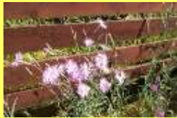
学名: Dianthus superbus var. longicalycinus 科名: ナデシコ