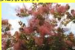
学名: Cotinus cogsygria 科名: ウルシ

雌雄異株の落葉樹で、雌木の枝先につく花序は遠くからは煙がくすぶっているように見えます。