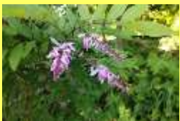
学名: Indigofera decora 科名: マメ

フジに似た花を咲かせます。フジと同じマメ科の植物でツル性ではなく落葉小低木です。