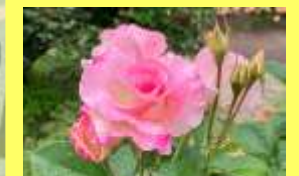
学名: Rosa 科名: バラ

春の見頃は例年5月中旬~6月中旬頃。原種やオールドローズ等、春にしか咲かないものもありますのでお見逃しなく!