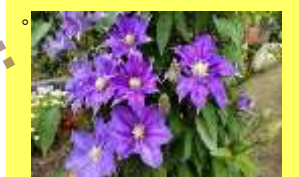
学名: Clematis 科名: キンボウゲ

つる性植物の女王と言われ、バラとの相性も抜群です。世界中で交配が進み、多くの品種が生まれています。