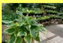
学名: Hosta 科名: キジカクシ

多くの園芸品種があり様々な葉の模様を楽しめます。見比べてみてお気に入りの葉を見つけてください。