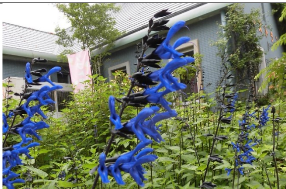
サルビア（グアラニティカ等）