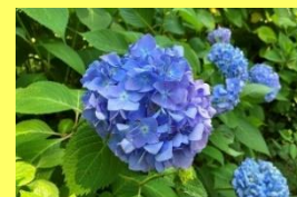
学名：Hydrangea 科名：アジサイ

雨も似合ってしまう6月の主役です。小さな花の集まりから「家族団圓」という花言葉もあるそうです。