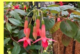
学名：Fuchsia 科名：アカバナ

「貴婦人の耳飾り」という英名通りの変わった形の花がぶら下がるように咲く様子が可愛らしいです。