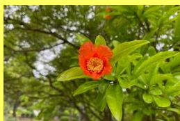
学名：Punica granatum 科名：ミソハギ

赤く可憐な花だけでなく、ガクにも注目してください。タコさんウィナーのようなユニークな形をしています。