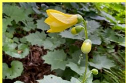
学名：Kirengeshoma palmata 科名：アジサイ

黄色い可愛らしい花を下向きに咲かせます。日本の固有種で和名が学名になっています。