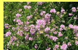
学名：Securigera varia 科名：マメ

フジというよりレンゲに似た可愛らしい花ですが、マメ科らしい旺盛な生育で野生化してしまいます。