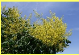
学名：Koelreuteria paniculata 科名：ムクロジ

寺院によく植えられる植物で、種子は数珠の材料になります。黄色く小さな花がたくさん咲きます。