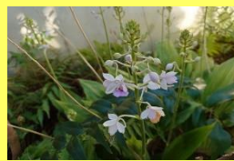
学名: Calanthe masuca 科名: ラン

「オナガ」の由来は、花の 付け根から飛び出た「距 (キョ)」と呼ばれるものが ひときわ長いことからです。