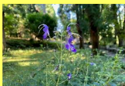
学名: Tripora divaricata 科名: シソ

青紫色のユニークな形の花を 咲かせます。鮮やかな色の花 ですが独特のおいを放ちま す。