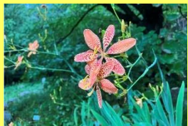
学名: Iris domestica 科名: アヤメ

葉が重なり合う様子を櫛の扇を を広げたように見立て「櫛 扇」。厄除けの植物として祇 園祭などにも欠かせません。