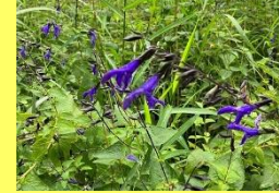
学名: Salvia 科名: シソ

晩秋にかけて様々な種類が開花 します。現在はグラニティカ やアキノタムラソウなどが見ら れます。昆虫も集まっています！