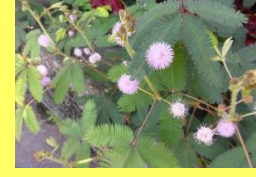
学名: Mimosa pudica 科名: マメ

葉に触れるとおじぎする以外に も、夜には葉を閉じて眠ったり、 ピンクのボンボンのような花を 咲かせたりと可愛さ満載です。