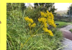
学名: Patrinia scabiosifolia 科名: スイカスラ

夏から秋にかけて、小さく 可愛い黄色い花を多数 咲かせます。秋の七草の一 つとして有名です。