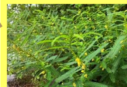
学名: Chamaecrista nomame 科名: マメ

河川改修や環境変化により大阪 では準絶滅危惧種。カワラケツメイ のみを食草とするツマグロキチヨ ウも激減し、希少になっています。