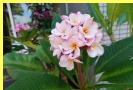
学名: Plumeria 科名: キョウチクトウ

花には芳香があり、ハワイ ではレイに使われることで 有名です。熱帯花木を代表 する花です。