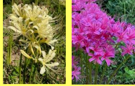
学名: Lycoris 科名: ヒガンバナ

秋頃になると花をつける球 根植物で、彼岸花もリコリス の一種です。色鮮やかな 花が放射状に咲きます。