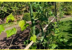
学名: Trichosanthes anguina 科名: ウリ

名前のごとくヘビのような ニョロっとした形のウリ。 他にも様々なウリ科の植物 を各所に植栽しています。