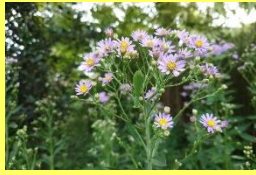
学名: Aster tataricus 科名: キク

シオン 和名は中国名の「紫苑」を音読みしたものです。別名は「十五夜草」。学名のAsterはギリシャ語で星を意味します。