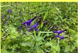
学名: Salvia 科名: シソ

サルビア 晩秋にかけて様々な種類が開花します。現在はグラニティカやレウカンサなどが見られます。昆虫も集まっています。