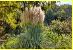
学名: Cortaderia selloana 科名: イネ

パンパスグラス 「おばけススキ」と呼ばれる巨大なイネ科の植物。「シロガネヨシ」の別名通り、白銀の穂が非常に美しいです。