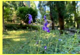
学名: Tripora divaricata 科名: シソ

カリガネソウ 青紫色のユニークな形の花を咲かせます。鮮やかな色の花ですが独特のにおいを放ちます。