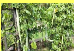
学名: Trichosanthes anguina 科名: ウリ

ヘビウリ 名前のごとくヘビのようなニョロっとした形のウリ。インド原産でカラスウリの仲間です。