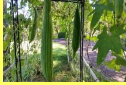
学名: Luffa 科名: ウリ

ヘチマ つる性植物でタワシや化粧水などにも利用されています。沖縄では若い実を料理に使います。