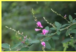
学名: Lespedeza 科名: マメ

ハギ 秋の七草の一つ。「万葉集」に最も多く詠まれた植物で、古くから日本人に親しまれてきました。