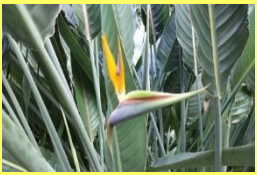
学名: Strelitzia reginae 科名: ゴクラクチョウカ

ゴクラクチョウカ 花は萼がオレンジ色で花弁が青色です。その姿が鳥を思わせることから極楽鳥花と呼ばれます。