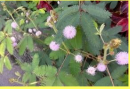
学名: Mimosa pudica 科名: マメ

オジギソウ 葉に触れるとおじぎする以外にも、夜には葉を閉じて眠ったり、ピンクのボンボンのような花を咲かせたりと可愛さ満載です。