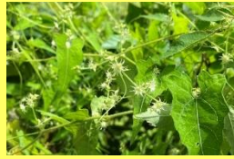
学名: Actinostemma tenerum 科名: ウリ

ゴキツル 名前のゴキは「合器（ごうき）」からきていて、果実が熟すと横に割れて、まるで蓋と容器に分かれる様だから。