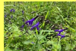
学名: Salvia 科名: シソ

晩秋にかけて様々な種類が開花します。現在はグラニティやレウカンサなどが見られます。昆虫も集まっています。