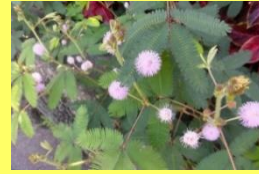
学名: Mimosa pudica 科名: マメ

葉に触れるとおじぎする以外にも、夜には葉を閉じて眠ったり、ピンクのボンボンのような花を咲かせたりと可愛さ満載です。