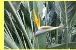
学名: Strelitzia reginae 科名: ゴクラクチョウカ

花は萼がオレンジ色で花弁が青色です。その姿が鳥を思わせることから極楽鳥花と呼ばれます。