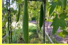
学名: Luffa 科名: ウリ

つる性植物でタワシや化粧水などにも利用されています。沖縄では若い実を料理に使います。