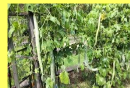
学名: Trichosanthes anguina 科名: ウリ

名前のごとくヘビのようなニョロっとした形のウリ。インド原産でカラスウリの仲間です。