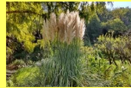
学名: Cortaderia selloana 科名: イネ

「おばけスキ」と呼ばれる巨大なイネ科の植物。「シロガネヨシ」の別名通り、白銀の穂が非常に美しいです。