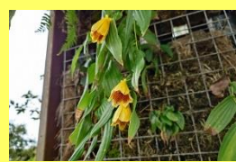
学名: Tricyrtis macranthopsis 科名: ユリ

名前に「キイ」と付いている通り、分布は紀伊半島南部に限られていて、絶滅危惧種に指定されています。