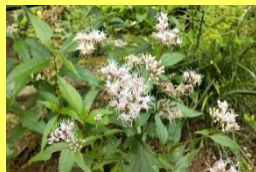
学名: Eupatorium japonicum 科名: キク

秋の七草のひとつ。生乾きの莖葉は桜餅の葉のような香りがし、中国では古く芳香剤として利用されたといわれています。