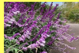
学名: Salvia 科名: シソ

晩秋にかけて様々な種類が開花します。現在はレウカンサ、エレガンス、イエローマジスティなどが見られます。