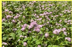
学名: Persicaria thunbergii var. thunbergii 科名: タデ

別名「牛の額」は葉の形が牛の顔に似ていることに由来。群生する様子も良いですが、近くで花一つ一つを見ても可愛いです