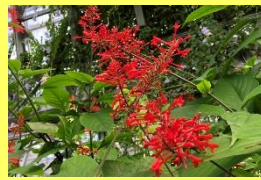
学名: Odontonema strictum 科名: キツネノマゴ