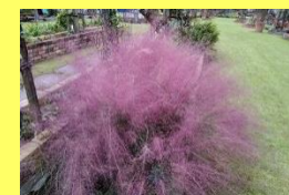
学名: Muhlenbergia capillaris 科名: イネ

北米原産のイネ科植物です。秋にピンクの花穂をつけます。風に揺れる美しい姿をご覧ください。