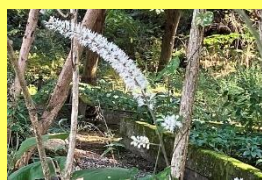
学名: Cimicifuga simplex 科名: キンボウゲ

「更科」ではなく「晒菜升麻」若い葉を水で晒して食用にすることに由来します。薬草としても用いられる部分もあります。