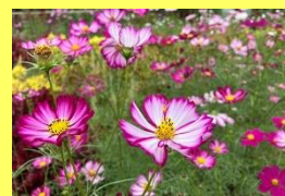
学名: Cosmos 科名: キク

「秋桜」という和名の通り、秋を代表する花の一つ。園内各所に植栽しており、イベント広場には全27種が揃います