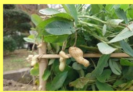
学名: Arachis hypogaea 科名: マメ

写真では空中にぶら下がっていますが、本来は、花後、花の付け根からつるが伸び土に潜り、地中で実を付けます。