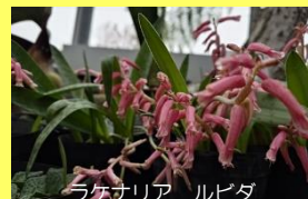
学名: Lachenalia 科名: キジカクシ

アフリカ大陸の南部に約130種が分布。その姿形・花色は非常に多彩で、それぞれ春にかけて開花し、夏には休眠をします。