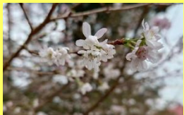
学名: Cerasus x subhirtella 'Autumnalis' 科名: バラ

秋にも開花することから十月桜といわれ、冬の間も咲き続け、春には更に華やかに咲き誇ります。