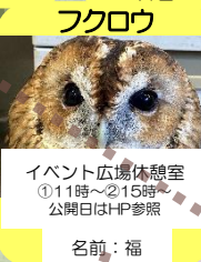
イベント広場体験室 ①11時~②15時 公開日はHP参照 名前: 福