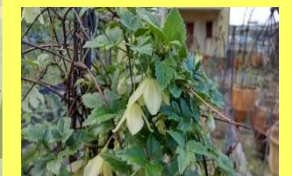
学名: Clematis cirrhosa 科名: キンポウゲ

クレマチスシルボサ 冬咲きの原種クレマチスです。古枝の節々にベル形の花を咲かせます。