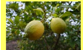
学名: Citrus limon 科名: ミカン

レモン 果物売り場ではお馴染みの黄色い実果が、大きな木に鈴生りになっている姿は、なかなかお目にかかれません。