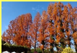
学名: Metasequoia elyptostroboides 科名: ヒノキ

日本で化石として発見され、その後、中国で生きた個体が発見されたことから「生きた化石」と呼ばれるようになりました。