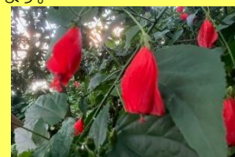
学名: Hibiscus sp. 科名: アオイ

つぼみの時は上を向き、開花するにつれ下を向く様子がうなずくようなのでウナスキヒメフヨウと名付けられたといわれています。