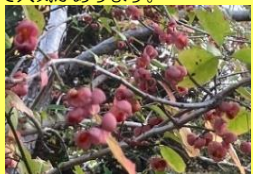
学名: Euonymus sieboldianus 科名: ニシキギ

秋になると薄い紅色の実が4つに割れ、赤い種子が現れます。個性的な実と種子に加え、紅葉も楽しめるので庭木や盆栽として人気があります。