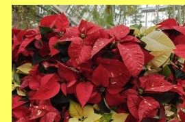
学名: Euphorbia pulcherrima 科名: トウダイグサ

今年もドレスになって登場します！赤色に色づいた部分は苞(ほう)で、花は苞の中心にある黄色い部分です。