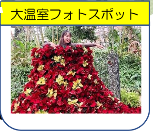
大温室はなぶんカフェ出口 ポインセチアドレス