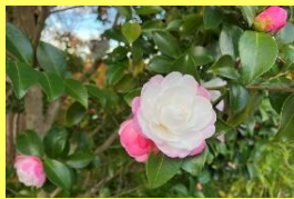
学名: Camellia sasanqua 科名: ツバキ

花が少なくなる季節に次々花を咲かせ、花色が豊富で品種も多いので、非常に人気の高い花木です。