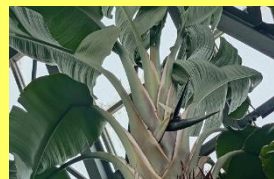
学名: Strelitzia nicolai 科名: ゴクラクチョウカ

見上げるほどの高い場所で、威風堂々とメタリックな輝きを放つ花は、皇帝の名にふさわしいです。