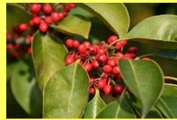
学名: Ilex rotunda 科名: モチノキ

黒鉄(クロガネ)色に輝く濃い緑の葉と灰白色の幹肌を持つ、クールに格好良い木です。