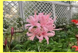
学名: Nerine cvs. 科名: ヒガンバナ

光が当たると花弁がダイヤモンドのようにキラキラ輝いて見えます。まさしく秋を彩る宝石です。