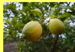
学名: Citrus limon 科名: ミカン

果物売り場ではお馴染みの黄色い果実が、大きな木に鈴生りになっている姿は、なかなかお目にかかれません。