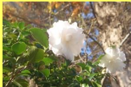
学名: Camellia sasanqua 科名: ツバキ

花が少なくなる季節に次々花を咲かせ、花色が豊富で品種も多いので、非常に人気の高い花木です。