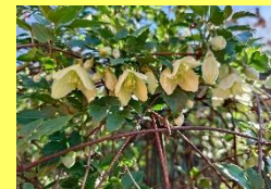
学名: Clematis cirrhosa 科名: キンボウゲ