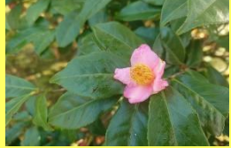
学名: Camellia rusticana × Camellia sinensis 科名: ツバキ

‘ロビラキ’ 「チャノキ」と「ユキツバキ」の自然交雑種です。両方の長所を受け継ぎ、ピンクの可愛い花を長期間咲かせます。