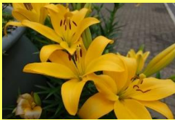
学名: Lilium 科名: ユリ

ユリの球根を-2℃前後で凍結貯蔵して植え付けの時期を調整すると、生花を年中安定して生産することができます。