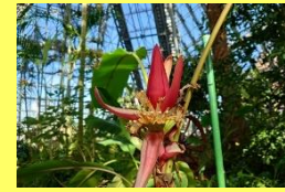
学名: Musa maanii 科名: バショウ