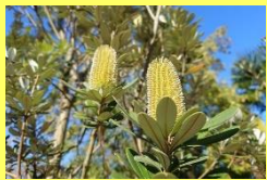
学名: Banksia integrifolia 科名: ヤマモガシ

昨今人気のオーシーブランツです。小花がブラシ状に固まって咲き、長期間咲き続けます。花後の造形もユニーク。