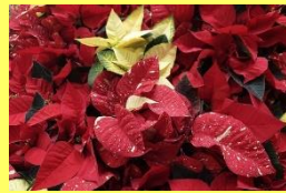
学名: Euphorbia pulcherrima 科名: トウダイグサ

毎年恒例、ポインセチアドレスの登場です。赤く色づいた部分は苞(ほう)で、花は苞の中心にある黄色い部分です。