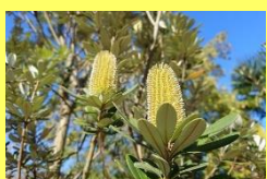
学名: Banksia integrifolia 科名: ヤマモガシ

昨今人気のオーシーブランツです。小花がブラシ状に固まって咲き、長期間咲き続けます。花後の造形もユニーク。