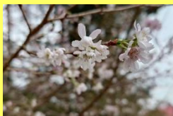
学名: Cerasus × subhirtella 'Autumnalis' 科名: バラ

秋にも開花することから十月桜といわれ、冬の間も咲き続け、春には更に華やかに咲き誇ります。