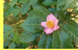
学名: Camellia rusticana × Camellia sinensis 科名: ツバキ

「チャノキ」と「ユキツバキ」の自然交雑種です。両方の長所を受け継ぎ、ピンクの可愛い花を長期間咲かせます。