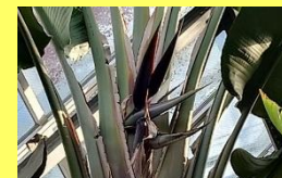
学名: Strelitzia nicolai 科名: コクラクチョウカ

見上げるほどの高い場所で、威風堂々とメタリックな輝きを放つ花は、皇帝の名にふさわしいたすまいです。