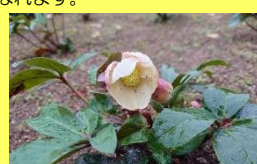
学名: Helleborus niger 科名: キンボウゲ

クリスマスの頃に咲くニゲルの別名が「クリスマスローズ」。でもなぜか2月頃咲くオリエンタリスも日本ではクリスマスローズと呼ばれます。