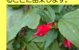
学名: Hibiscus sp. 科名: アオイ

名前はつぼみの時は上を向き、開花するにつれ下を向く様子がうなずくようであることに由来します。