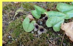
学名: Asarum takaoi var. futoana 科名: ウマノスズクサ

カンアオイは実は地方ごとの固有種が多く、イズミカンアオイは和歌山県と大阪府の県境にのみ分布します。