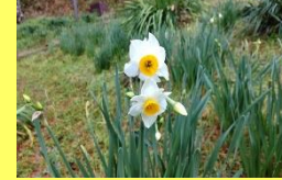
②学名: Narcissus tazetta var. chinensis 科名: ヒガンバナ

名前に「ニホン」とありますが、原産地は地中海沿岸です。中国経由で来日、今では関東以西の暖地に自生しています。