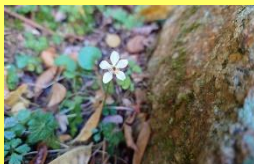
学名: Coptis quinquefolia 科名: キンボウゲ

気の早い個体が咲き始めました。春の到来を告げるスプリング・エフェメラルたちの先陣を切ってます。