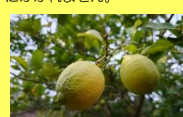
学名: Citrus limon 科名: ミカン

果物売り場ではお馴染みの黄色い果実が、大きな木に鈴生りになっている姿は、なかなかお目にかかれません。