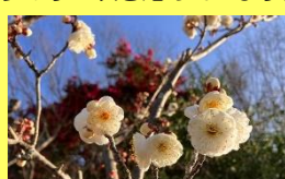
学名: Armeniaca mume 科名: バラ

学名の「mume(ムメ)」はシーボルトが名付けました。季節外れの陽気に誘われ、少しずつ咲き始めています。