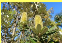
学名: Banksia integrifolia 科名: ヤマモガシ

昨今人気のオーシーブランツです。小花がブラシ状に固まって咲き、長期間咲き続けます。花後の造形もユニーク。