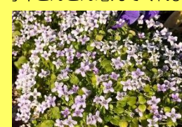
学名: Ionopsidium acaule 科名: アブラナ

ヒメムラサキハナナやパイオレットクレスの別名があります。一度植えるとおぼれ種で毎年どんどん増えてくれます