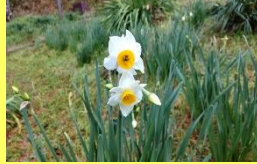
学名: Narcissus tazetta var. chinensis 科名: ヒガンバナ

名前に「ニホン」とありますが、原産地は地中海沿岸です。中国経由で来日、今では関東以西の暖地に自生しています。