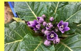
学名: Mandragora officinarum 科名: ナス

人型にも見える奇妙な根の形から、持ち主は魔法使いであるとか、引き抜くと悲鳴を上げるといった逸話がいくつもあります