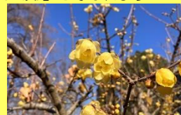
学名: Chimonanthus praecox 科名: ロウバイ

寒さの厳しい季節に花を咲かせ、中国ではウメ、スイセン、ツバキとともに「雪中の四花(四友)」と呼ばれます