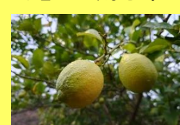
学名: Citrus limon 科名: ミカン

果物売り場ではお馴染みの黄色い果実が、大きな木に鈴生りにになっている姿は、なかなかお目にかかれません。